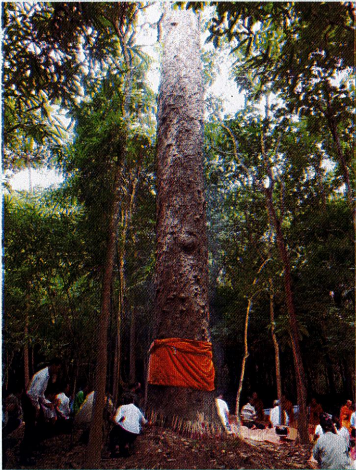
อนุรักษ์ป่า "ป่าชุมชน" เพื่อสิ่งแวดล้อมที่ดีตามวิถีชุมชน